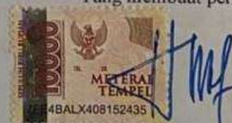
Intan Noviyanti NIM 40420015