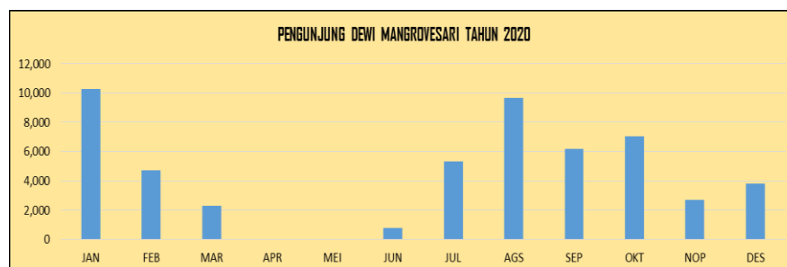
Grafik 1.3 Pengunjung objek wisata hutan mangrove tahun 2020